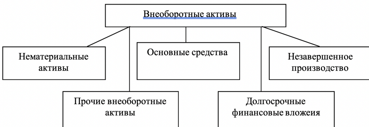
Рис. 2. Состав внеоборотных активов.

Многие авторы дают разные трактовки понятия внеоборотные активы, мы остановимся на понятии, которое дает Н. Н. Селезнева: «Внеоборотные активы — это набор инструментов, с помощью которых современные организации могут получать прибыль и вести финансово-хозяйственную деятельность» (Селезнева, 2017: 217). Состав внеоборотных активов представлен на рисунке 2.