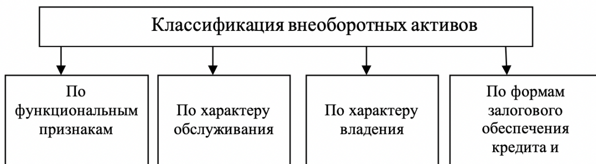
Рис. 3. Классификация внеоборотных активов.

Классификация внеоборотных активов представлена на рисунке 3.