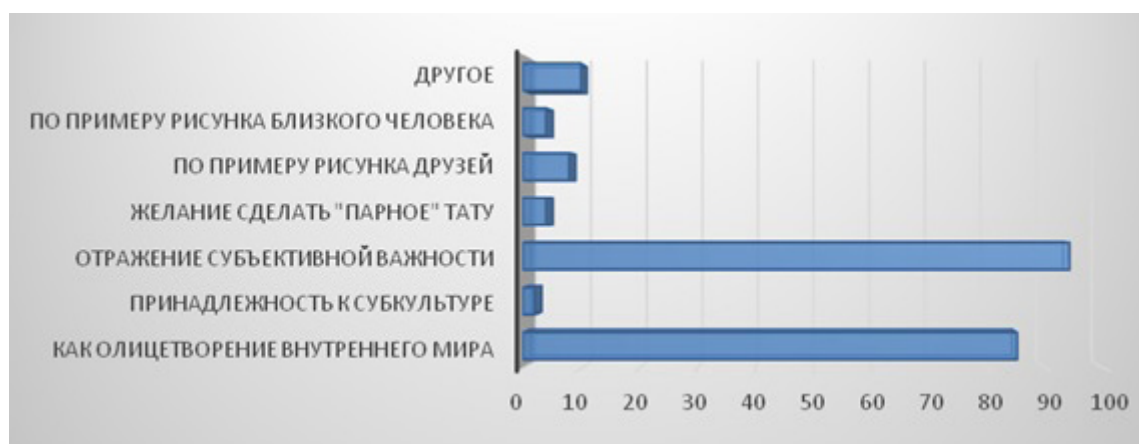
Рис. 2. Причины выбора определенного рисунка для татуировки.

Типичный представитель молодежи с татуировками считает для себя ценным саморазвитие, испытывает удовлетворенность дружескими (75%) и семейными отношениями (65%), часто посещает общественные места (преимущественно парки — 75%, кинотеатры — 51%, фитнес-залы — 37%), любит свою работу (60%). Выявлены довольно низкая удовлетворенность материальным положением (42%) и критичный уровень доверия к органам государственной власти и управления (законодательной, исполнительной, судебным органам — от 11% до 18%).