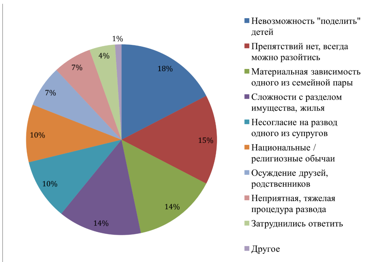
Рис. 2. Что мешает супружеским парам развестись, мнения граждан РФ по данным опроса ВЦИОМ, в %

Также стоит отметить, что почти 40 % разведенных граждан указывали, что развод произошел по причине спешки в выборе партнера.