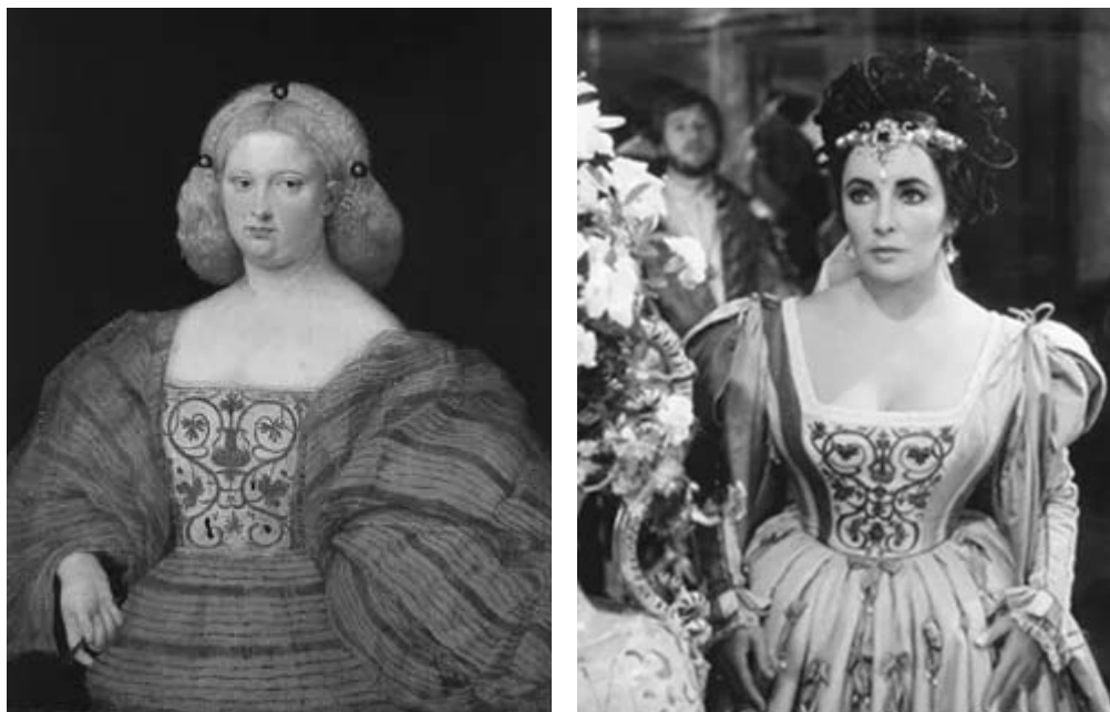
Рис. 4. Джованни Буси (Карьяни). «Портрет женщины в полосатом платье» 1530–1535 гг. (Giovanni Busi, gen. Cariani: Электронный ресурс)