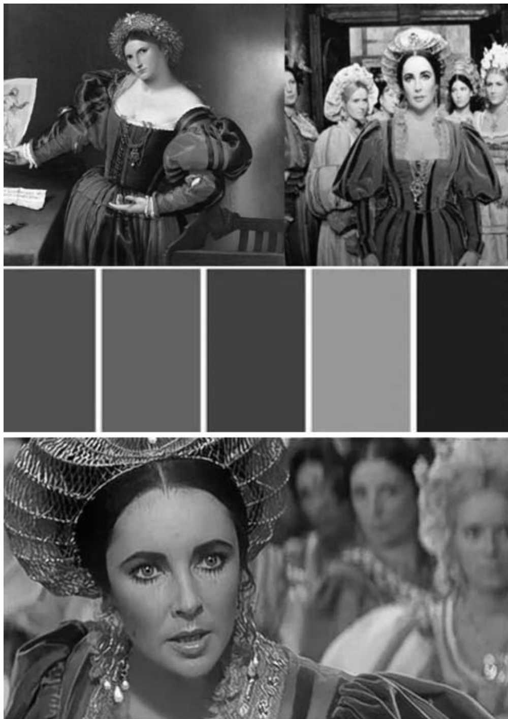
Рис. 5. Мудборд для создания эскизного проекта