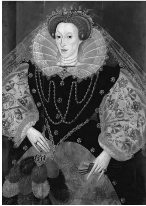
Рис. 2. Портреты Елизаветы Тюдор XVI в. Pic. 2. 16th century portraits of Elizabeth Tudor