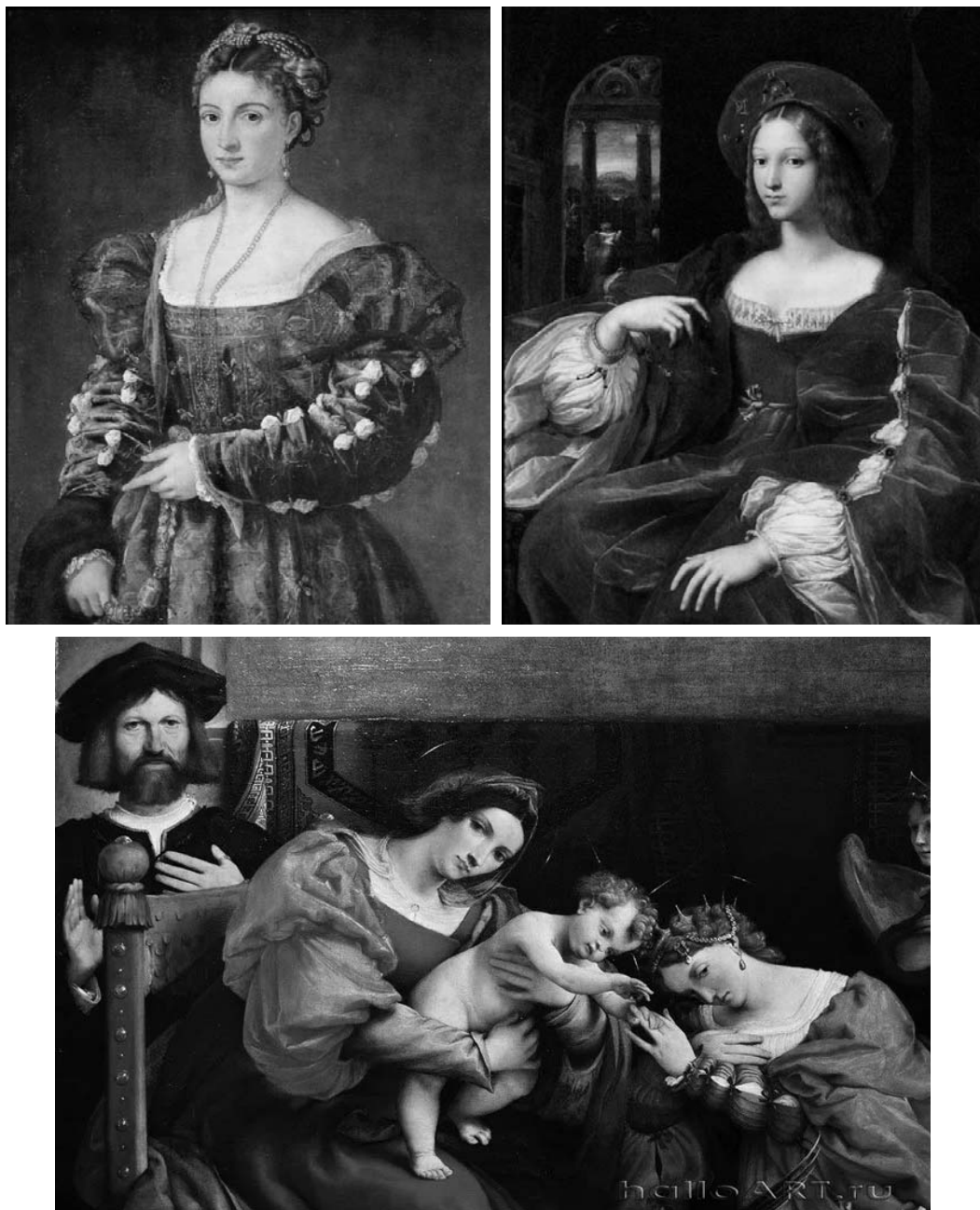
Рис. 1. Понтормо. «Портрет дамы [леди] в красном со щенком»; Витторе Карпаччо. «Читаящая Мадонна»; Тициан. «Красавица»; Рафаэль. «Портрет Иоанны Арагонской»; Лоренцо Лотто. «Таинственный брак Св. Катерины Александрийской с Николо Бонги» (Беренсон, 1953: 121)

Pic. 1. Pontormo. "Portrait of Lady in Red with Puppy"; Vittore Carpaccio. "The Virgin Reading"; Raphael. "Portrait of Joanna of Aragon"; Titian. "La Bella"; Lorenzo Lotto. "Mystical Marriage of St Catherine of Alexandria with Niccolò Bonghi" (Berenson, 1953: 121)