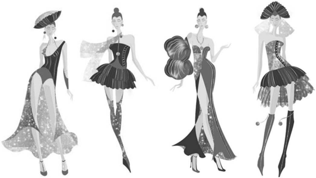
Рис. 7. Современные костюмы современного сценического действия под девизом «Стронтивицы». Автор эскизов О. В. Калько

Данные особенности костюмов дополняются современными аспектами: юбки укороченной длины, асимметричность деталей костюмов, перчатки и чулки современных форм, высокие разрезы или открытые части тела, фантазийные головные уборы и обувь (рис. 7).