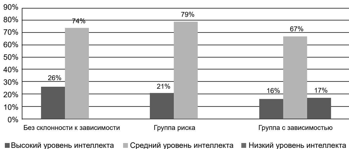
Рис.2. Распределение испытуемых с высокими, средними и низкими показателями теста Равена в группах с разной степенью выраженности склонности к интернет-зависимости

электронных средств передачи информации, а также компьютерных игр, связано, по-видимому, с его влиянием не столько на интеллект, сколько на внимание.